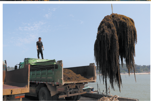
浙江洞头羊栖菜丰收。