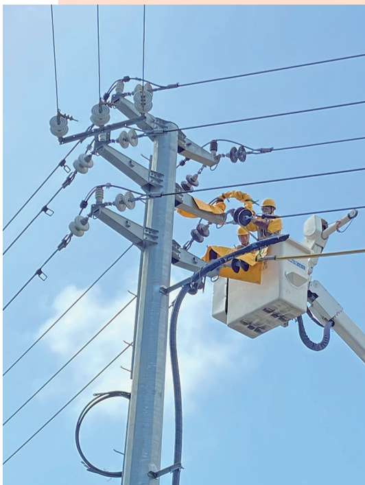
电力工人们在高空不停电作业。