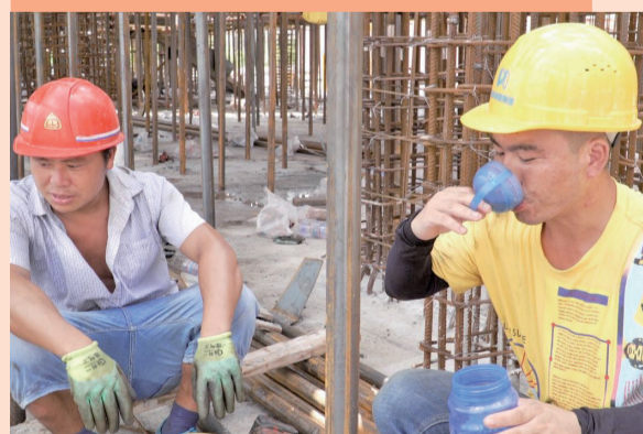
建筑工人们喝茶消暑。